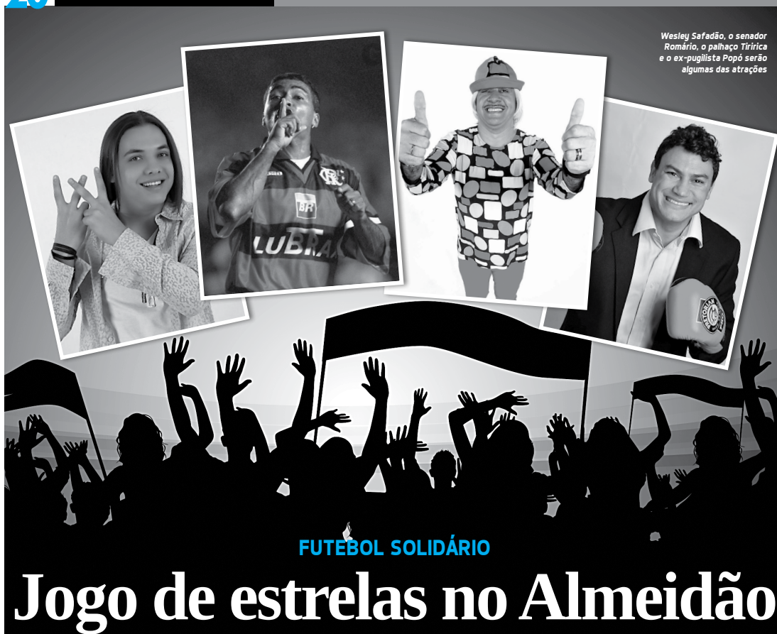
Wesley Safadão, o senador Romário, o palhaço Tírrica e o ex-pugilista Popó serão algumas das atrações