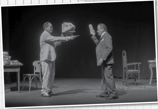
“De João para João”