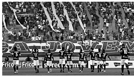
O Goiás, remanescente da Série A, deverá levar um grande público para jogo contra o Londrina-PR