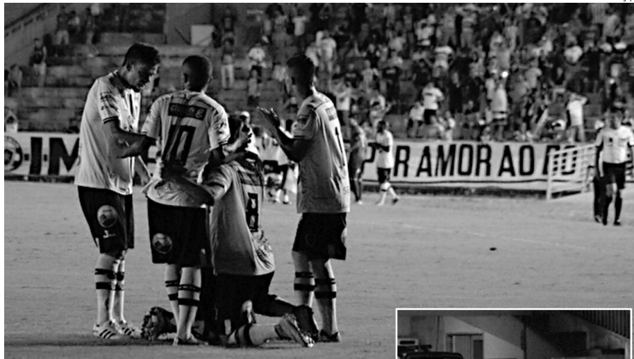
Na noite da última quarta-feira, o Botafogo voltou a vencer e eliminou da competição o River-PI

Indagado sobre se o time está pronto para a Sé-