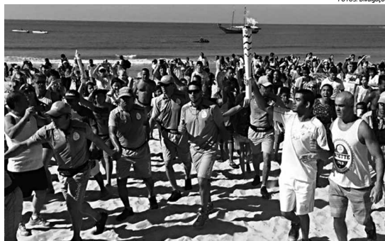
Antes de ir a Teixeira de Freitas, a tocha passou pela orla marítima capixaba atraindo multidão