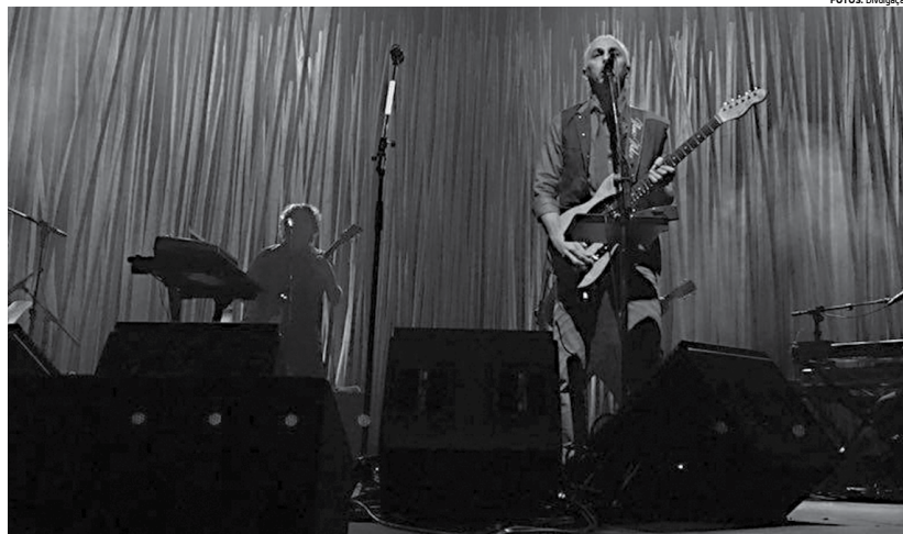
O artista maranhense Zeca Baleiro é considerado um dos maiores nomes da música brasileira na atualidade e tem uma legião de fãs

Pra começar, Zeca chamou os músicos que o acompanham, alguns há mais de dez