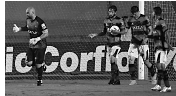
O Atlético-GO joga em seus domínios contra o Brasil de Pelotas

Três jogos abrem hoje a Série B do Campeonato Brasileiro de Futebol, partidas estas encaradas por alguns dos times envolvidos, como de recuperação, haja vista que, na rodada de abertura, na semana passada, estrearam com derrotas, decepcionando seus torcedores e contrariando a comissão técnica por seus trabalhos realizados.