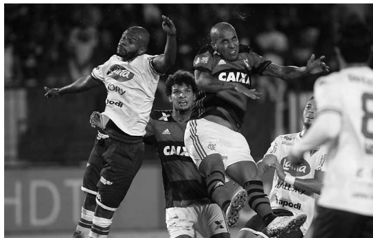
Nos dois jogos da Copa do Brasil, o Flamengo, que é Primeira Divisão, perde para time da 3ª Divisão