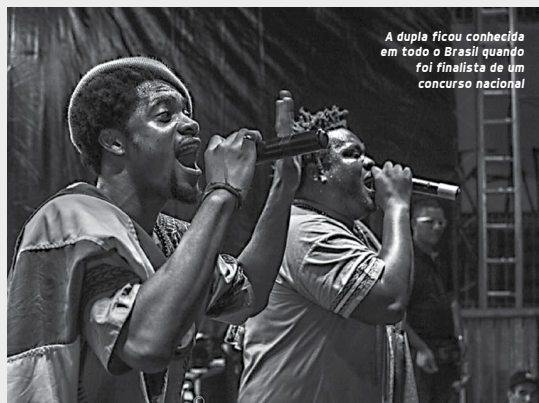
A dupla ficou conhecida em todo o Brasil quando foi finalista de um concurso nacional

trar a riqueza do povo africano, o primeiro disco da dupla chamado “Primeiro Passo”. Composto por 14 faixas, as suas letras abordam assuntos como a integração do continente africano com o mundo, a realidade do povo africano, a mistura presente na cultura afro-brasileira e a juventude.