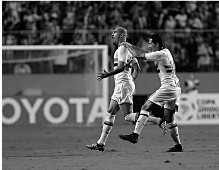
Bastou apenas um gol para o São Paulo despachar o Atlético-MG e chegar às semifinais da competição justamente seis anos depois