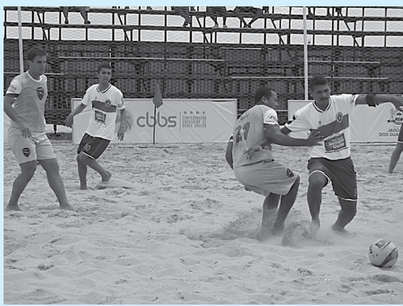
A competição de integração reúne várias equipes do cenário esportivo de futebol de areia do Nordeste

tância para observar os novos atletas o grupo. Estão de parabéns os organizadores pela iniciativa de realizar um torneio com equipes qualificadas", avaliou. (WS)