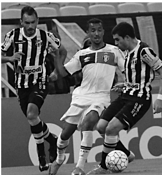
O time do Ceará se classificou passando pelo Joinville e será concorrente difícil para o Botafogo

O próximo jogo do Botafogo, na Copa do Brasil, só acontecerá no início do mês de julho. Segundo o calendário distribuído pela CBF, as partidas da terceira fase acontecerão nos dias 6, 13, 20 e 27 de julho. As datas e a ordem dos jogos só serão definidas nos próximos dias. Nesta fase, a vantagem de jogar a segunda e decisiva partida em casa, será definida por sorteio, e não pela colocação do Ranking Nacional de Clubes. Outra mudança é que acaba a vantagem da equipe visitante eliminar o time da casa, em caso de uma vitória superior a dois gols.